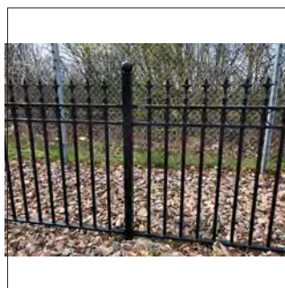
Diskreta fästen för sektioner