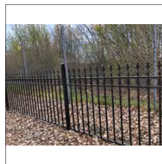
LUX i svart, RAL 9005