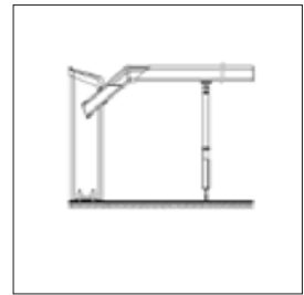
Bom med pendelstöd