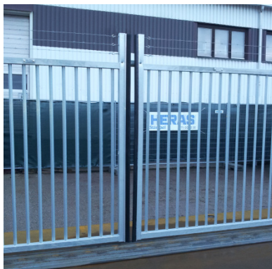
Kodlås för öppning