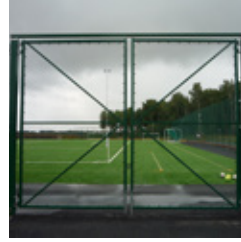
Dubbel körgrind i mörkgrönt utförande