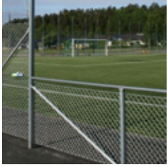
Stödräcke av flätverksstängsel med överliggerare