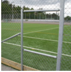
Bollglugg - Bollhämterhåll