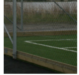
Bollplanka monterat utmed stängsellinjen