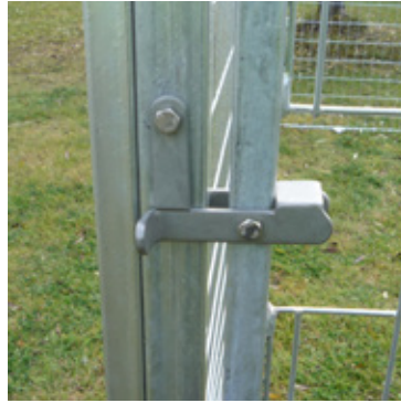
Lås för dörrsektion