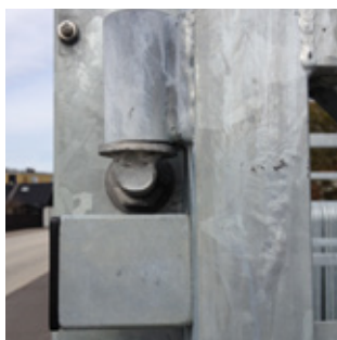
Gångjärn & avlyftningsskydd