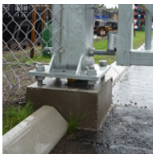
Grindstolpe med fotplatta