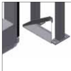
Detaljerad bild av stötskydd