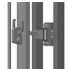
Detaljerad bild av låsning (tillval)