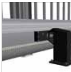
Detaljerad bild av styrhjulen