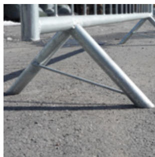
Kravallstaket fast V-fot