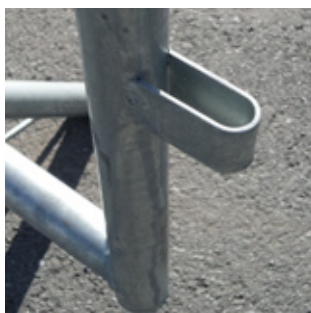
Ögla för länkning