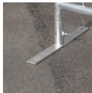
Kravallstaket lös T-fot