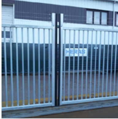
Kodlås för öppning