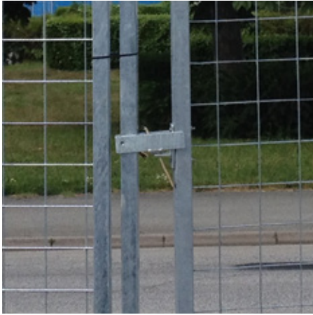
Fällregel - dubbelgrind